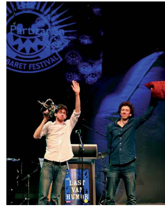
De Partizanen.